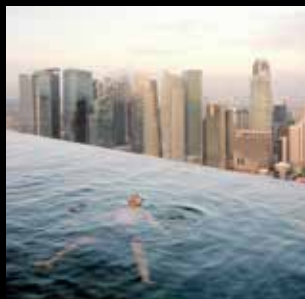
Tirages réalisés par CEWE

Michel RAJKOVIC Nowhere Le paysage ne devient qu'un prétexte, et tel un chemin il nous mène vers un voyage intérieur.